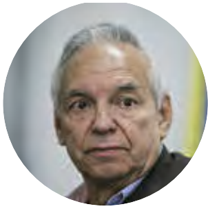
RICARDO BONILLA Ministro de Hacienda