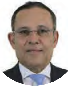
EFRAÍN CEPEDA Presidente del Senado